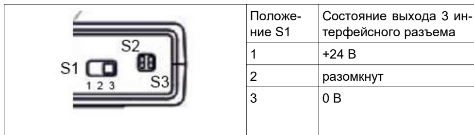
Таблица 3 - Технические характеристики адаптера связи